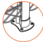
Kit poste base Aluminio moldeado por inyección 125 x 150 x 58 mm