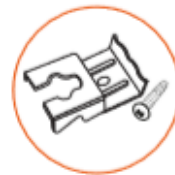
Grapa oval 55 x 34 x 10 mm