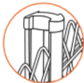
Tapa Polipropileno 70 x 90 x 30 mm