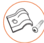
Media grapa 3 x 30 x 11 mm